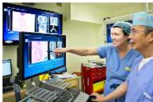
Gambar 3. Pemanfaatan teknologi informasi dalam bidang kegiatan medis / kesehatan.

ternyata memiliki banyak manfaat yang tidak bisa disepelekan. Dalam bidang kesehatan, komputer memiliki peranan yang sangat penting. Komputer banyak digunakan untuk berbagai hal, terutama dalam organisasi seperti rumah sakit, klinik, Puskesmas dan lain sebagainya. Jadi, secara tidak langsung perangkat komputer dapat membantu menolong jiwa manusia. Penggunaan komputer yang paling sederhana dalam bidang kesehatan yaitu penyimpanan data. Sementara dalam organisasi baik klinik atau rumah sakit, ada banyak data yang harus disimpan. Bayangkan saja betapa melelahkannya menyimpan data secara manual tanpa menggunakan komputer. Selain lebih mudah dalam penyimpanan data, komputer juga dapat mempermudah dalam pengolahan data. Petugas dapat melihat berbagai informasi dari data yang sudah disimpan dan juga diolah menggunakan komputer. Sementara teknologi informasi sendiri meliputi hal yang berkaitan dengan manipulasi, proses dan pengelolaan informasi. Perkembangan dunia teknologi yang begitu pesat memang sangat disayangkan jika tidak dimanfaatkan semaksimal mungkin. Begitu juga dalam dunia kesehatan, teknologi informasi memang sudah seharusnya dimanfaatkan semaksimal mungkin. Dalam dunia kesehatan, teknologi informasi merupakan hal yang penting dan juga sangat mendasar.