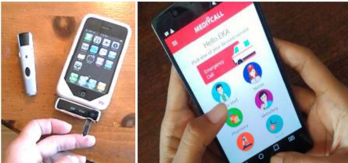
Gambar 2. Bentuk aplikasi teknologi informasi menggunakan smartphone di bidang kesehatan.

kesehatan lewat perpaduannya dengan teknologi telah menciptakan berbagai macam teknik pengobatan yang dulu tidak terpikirkan sebelumnya. Saat ini operasi yang rumit dengan kebutuhan tingkat ketelitian yang tinggi sudah dapat dilakukan dengan menggunakan robot. Bahkan saat ini dengan penemuan teknologi 3D printing ada kemungkinan manusia akan bisa memperbaiki komponen organ manusia yang rusak dengan menciptakan bagian yang rusak itu dengan teknologi 3D printing. Kemajuan teknologi di bidang kesehatan memang dapat memberikan banyak manfaat terutama dalam pemerataan akses dan informasi terhadap kesehatan, namun banyak juga pihak yang khawatir terhadap dampak buruk yang akan dapat ditimbulkan dari hal ini. Contohnya adalah berkembangnya teknologi tentang penyedia informasi kesehatan atau alat diagnosa kesehatan yang dapat digunakan sendiri akan membawa kekhawatiran terhadap eksistensi profesi dokter dan tenaga kesehatan lainnya di tengah-tengah masyarakat. Bagaimanapun teknologi tetaplah sebuah alat untuk kehidupan manusia, jika tidak bijak menggunakannya tetap akan membawa keburukan untuk kehidupan manusia.