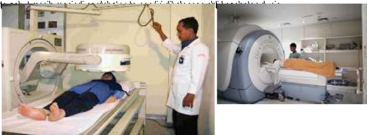
Gambar 1. Perkembangan teknologi di bidang kesehatan.