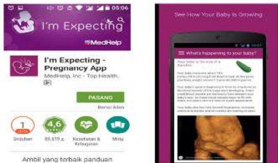
Gambar 5. Aplikasi pemantauan kesehatan janin